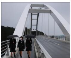
気仙沼大島大橋にて見学しました。

建築科1年生は12月17日(金)、百年を超える期間十分な強度をもつて耐える橋梁として設計された「気仙沼大島大橋」にて見学しました。