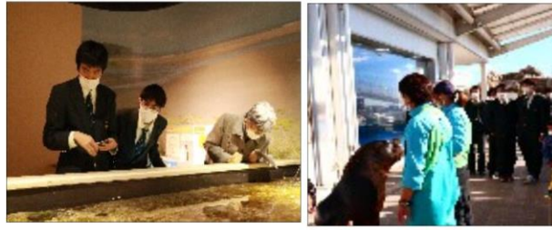
うみの杜水族館見学の様子

工業化学科は12月15日(水)、水環境の学習のため、全学年合同で仙台うみの杜水族館の施設見学に行つて来ました。