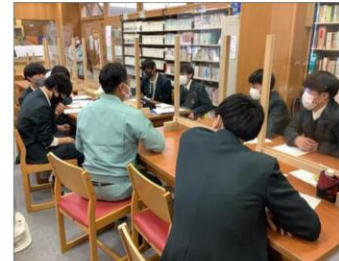
図書室内での交流の様子

電気科1、2年生は、12月10日(金)に施設見学に行つて来ました。2年生は「女川原子力発電所」と「原子力PRセンター」へ、1年生は「株トキシン白石事業所」を見学しました。