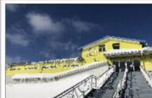
みやぎ蔵王白石スキー場

令和4年1月24日(月)〜26日(水)ですが、青空の下、みやぎ蔵王白石スキー場にて1学年行事のスキー教室が、午前中は立ち上るのも一苦労だった生徒も、午後