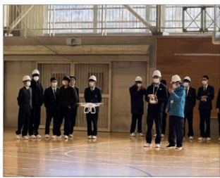
ドローン体験会の様子