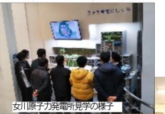
女川原子力発電所見学の様子

電気科1、2年生は、12月10日(金)に施設見学に行つて来ました。2年生は「女川原子力発電所」と「原子力PRセンター」へ、1年生は「株トキシン白石事業所」を見学しました。