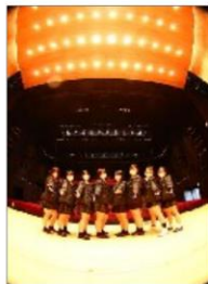
マルホンまさあーとテラスにて

建築科2年生は12月15日(水)「マルホンまさあーとテラス」と「石ノ森萬画館」を見学し、「建築デザイン」「建築計画」「建築構造」などを学びました。