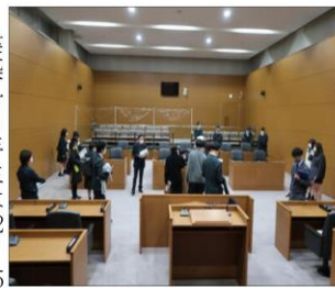
女川町役場庁舎 議場にて

建築科3年生は12月17日(金)「女川町役場庁舎」(金)「シーパルピア女川」を見学しました。落ちそうに落ちない巨石がある「釣石神社」も訪れ、参拝してきました。