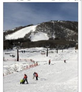
スキー教室の様子

からは感覚を掴み、午後にはリフトに乗ってゲレンデを悠々と滑ることができ、「疲れたー!」と言いなながらも爽やかな笑顔を見せてくれました。