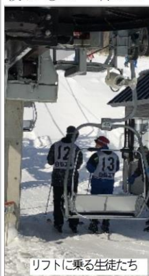
リフトに乗る生徒たち

令和4年1月24日(月)〜26日(水)ですが、青空の下、みやぎ蔵王白石スキー場にて1学年行事のスキー教室が、午前中は立ち上るのも一苦労だった生徒も、午後