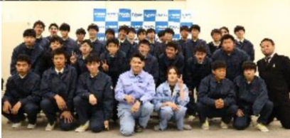
電気科1年生集合写真