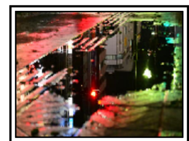
石川修麻『夜に光る裏世界の扉』