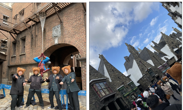
ユニバーサルスタジオジャパンにて(2年生)