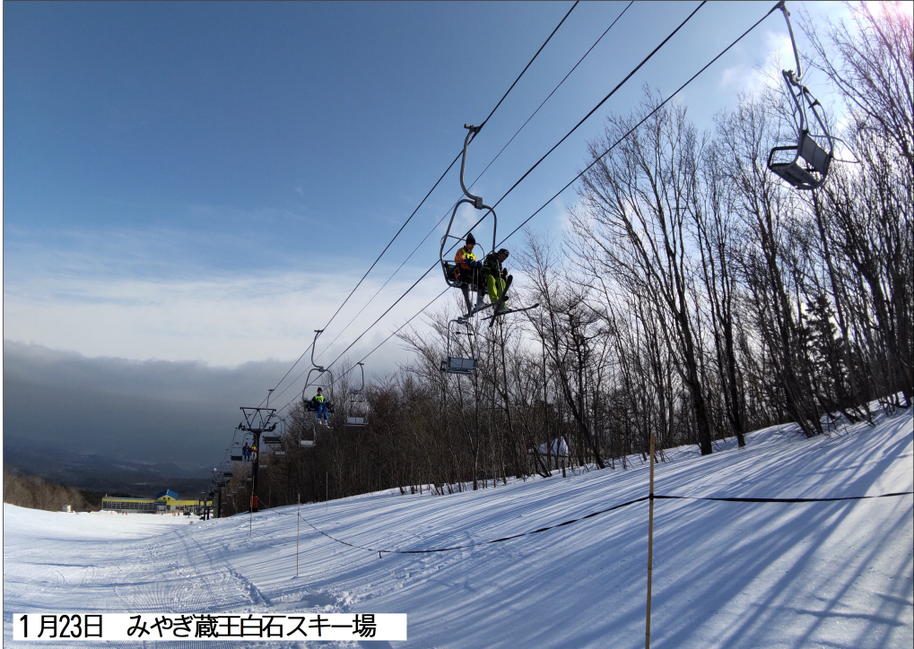
1月23日 みやぎ蔵王白石スキー場

天候に恵まれ、輝く雪原を滑ったクラスもあれば、数年に1度と言われた大寒波に当たってしまったクラスもありました。大寒波の25日は気温マイナス14℃と、今季一番の冷え込みを記録しました。楽しく滑れるようになってきたところでリフトが運転中止となり、断念せざるを得なくなりました。念せざるを得なくなりましたが、それも含めて身をもって自然を体感しました。